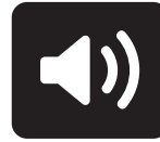
Ajuste de áudio