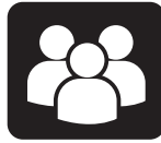
Comunicação de áudio