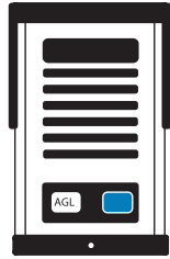
1 Unidade externa de Porteiro Eletrônico