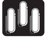
Permite 3 extensões