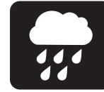
Resistente a chuva