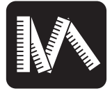
Instalação até 500m de distância*